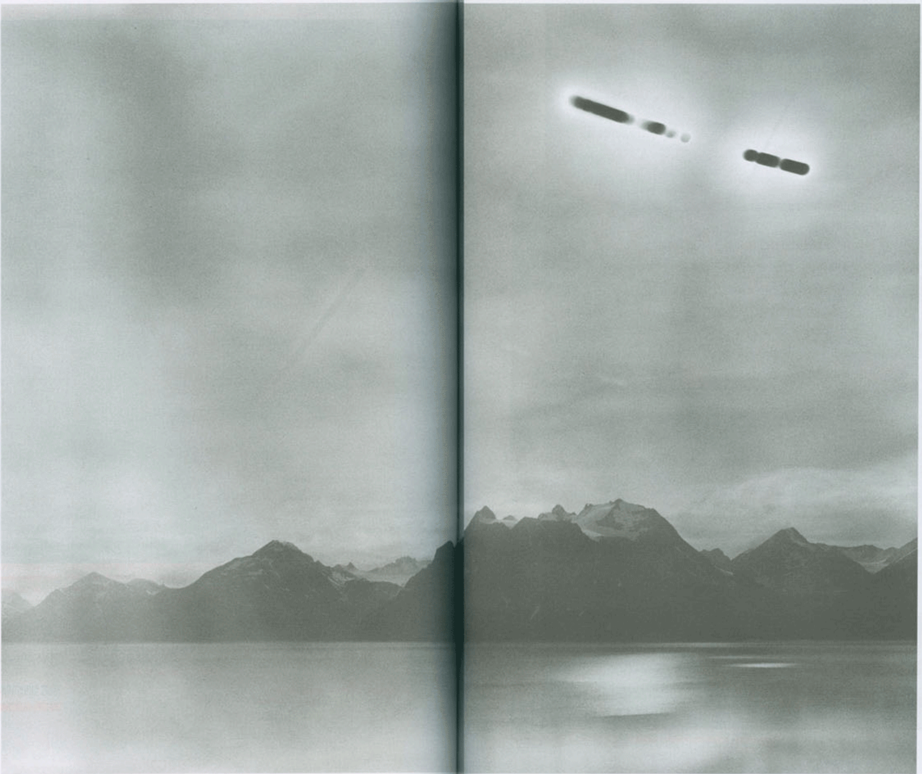
7/11/2007, 5:27 pm - 6:27 pm, N 69°45.199' E 020°49.497'