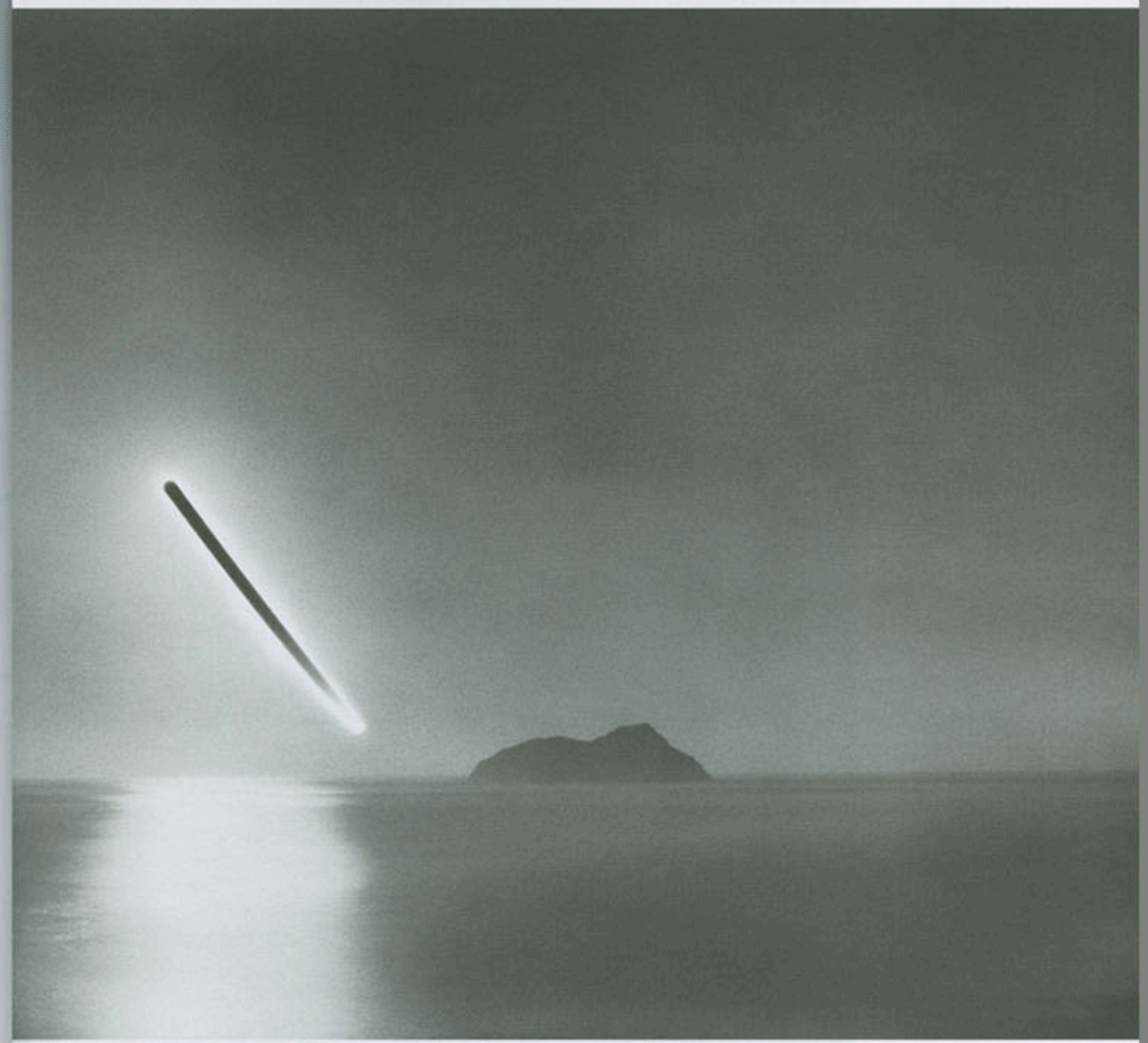
2/20/2010, 6:53 am - 7:53 am, 53°40.83' E 178°38.635'

La curiosidad y la disponibilidad de dar una segunda mirada (en su propio trabajo en particular).