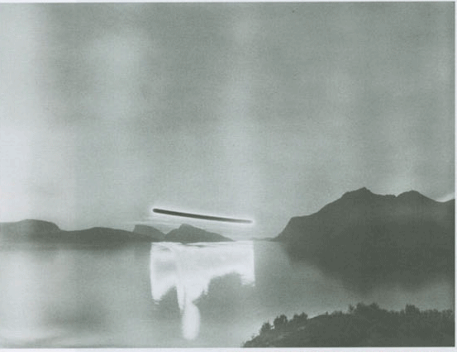
2/4/2007 - 2:15:2007, 11:28 pm - 0:28 am, N 69°37.661' E 018°19.470'